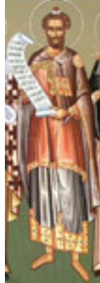
Προφήτης Μωυσής ο Θεόπτης