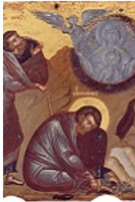
Προφήτης Μωσής ο Θεόπτης