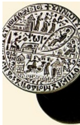
Σφραγίδα Μονής Διονυσίου με τις παράστασεις της Γεννήσεως του Προδρόμου και της Αποτομής της κεφαλής του Προδρόμου - 1636 μ.Χ. - Μονή Διονυσίου, Άγιον Όρος