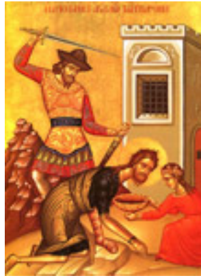
Η Αποτομή της Τιμίας Κεφαλής του Αγίου Ιωάννου του Προδρόμου