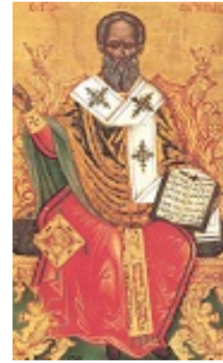
Άγιος Αντίπας Επίσκοπος Περγάμου Άγιος Αντίπας Επίσκοπος Περγάμου Άγιος Αντίπας Επίσκοπος Περγάμου