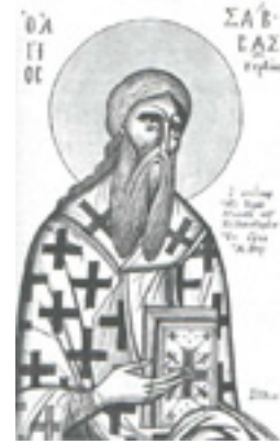
Όσιος Σάββας πρώτος Αρχιεπίσκοπος Σερβίας και κήτρω Ιεράς Μονής Χιλανδαρίου