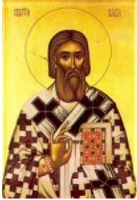
Όσιος Σάββας πρώτος Αρχιεπίσκοπος Σερβίας και κήτρω Ιεράς Μονής Χιλανδαρίου