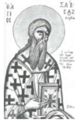
Όσιος Σάββας πρώτος Αρχιεπίσκοπος Σερβίας και κήτρω Ιεράς Μονής Χιλανδαρίου