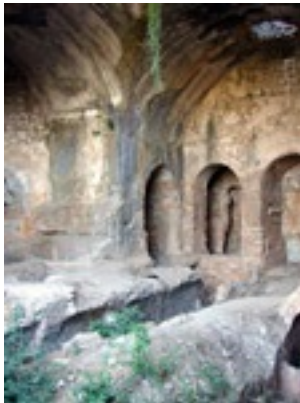
Το σπήλαιο των Επτά Παίδων στην Έφεσο