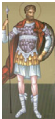
Άγιος Ανδρέας ο Στρατηλάτης