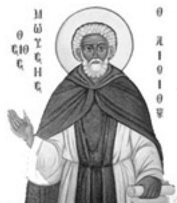
Όσιος Μωυσής ο Αιθίοπας