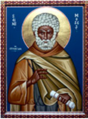
Όσιος Μωυσής ο Αιθίοπας