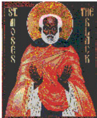
Όσιος Μωυσής ο Αιθίοπας