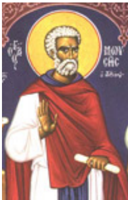
Όσιος Μωυσής ο Αιθίοπας