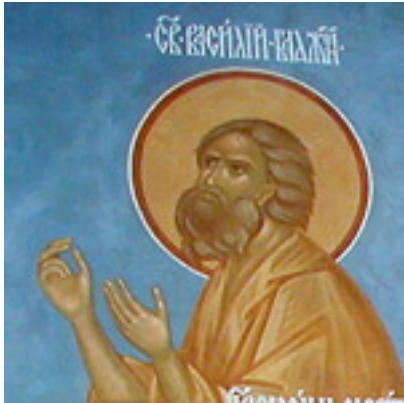
Άγιος Βασίλειος ο δια Χριστόν σαλός και θαυματουργός