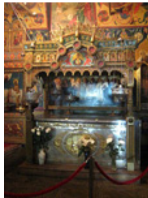
Ο τάφος του Αγίου Βασιλείου του δια Χριστόν Σαλού στον ναό του στην Κόκκινη Πλατεία