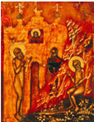
Θαύμα του Αγίου Βασιλείου του δια Χριστόν Σαλού