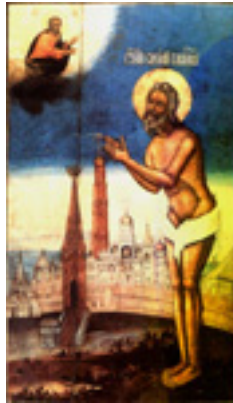
Άγιος Βασίλειος ο δια Χριστόν σαλός και θαυματουργός