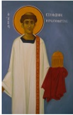
Άγιος Στέφανος ο Πρωτομάρτυρας - I. N. Οσίων Παρθενίου και Ευμενίου των εν Κουδουμά, δια χειρός Παναγιώτη Μόσχου (2006 μ.Χ.)