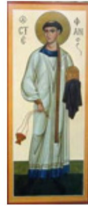
Άγιος Στέφανος ο Πρωτομάρτυρας