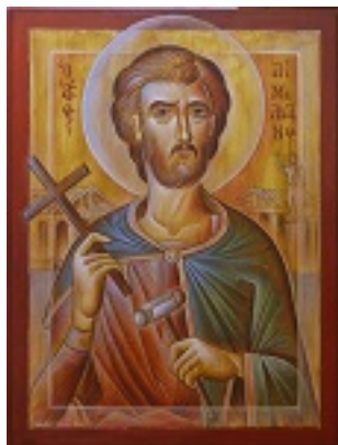
Άγιος Αμιλιανός - Γιώργος Χατζής© (hatzis-art.blogspot.com)