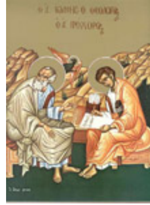
Άγιος Πρόχορος και Άγιος Ιωάννης ο Θεολόγος