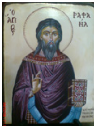
Άγιος Ραφαήλ - www.zografiki.com