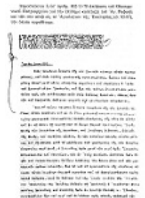
Επίσημος κατάταξη του Αγ. Ραφαήλ και των συν αυτώ, εις το Αγιολόγιον της Εκκλησίας