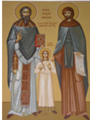
Άγιοι Ραφαήλ, Νικόλαος, Ειρήνη και οι συν αυτοίς