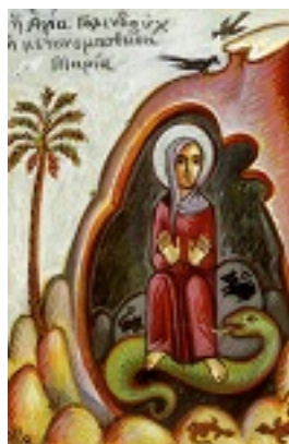
Αγία Γολινδοῦχ ἡ Περίδα που μετονομάστηκε Μαρία