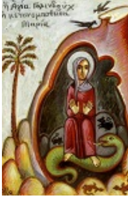
Αγία Γολινδοῦχ ἡ Περίδα που μετονομάστηκε Μαρία