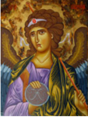
Αρχάγγελος Γαβριήλ - Λυδία Γουριώτη© ( http://lydiagourioti- iconography.blogspot.com )