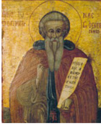
Άγιος Ιωάννης ο εν Περγάμω της Κύπρου