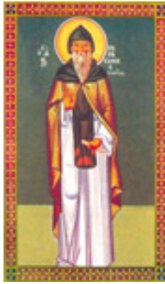
Όσιος Γεράσιμος<br />ο Βυζάντιος