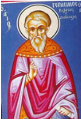
Όσιος Γεράσιμος<br />ο Βυζάντιος