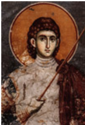
Άγιος Προκόπιος ο Μεγαλομάρτυς