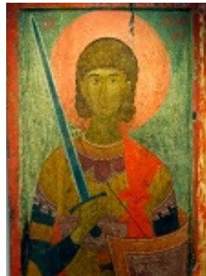
Άγιος Προκόπιος ο Μεγαλομάρτυς