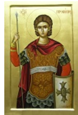
Άγιος Προκόπιος ο Μεγαλομάρτυς