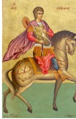
Άγιος Προκόπιος ο Μεγαλομάρτυς -