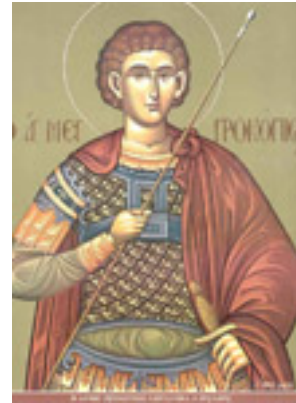
Άγιος Προκόπιος ο Μεγαλομάρτυς