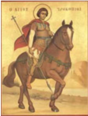
Άγιος Προκόπιος ο Μεγαλομάρτυς