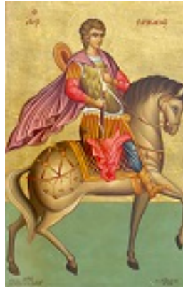
Άγιος Προκόπιος ο Μεγαλομάρτυς -