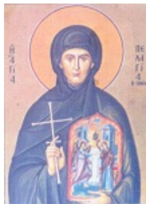
Οσία Πελαγία η Τηνία