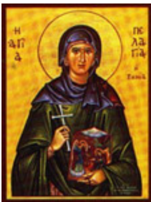
Οσία Πελαγία η Τηνία