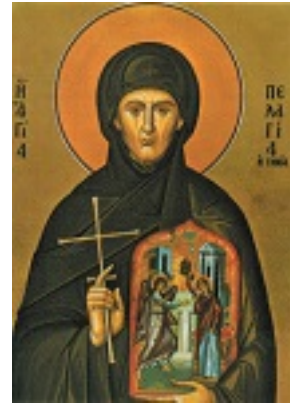
Οσία Πελαγία η Τηνία