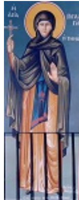
Οσία Πελαγία η Τηνία