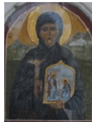
Οσία Πελαγία η Τηνία, Ιερός Ναός Ευαγγελιστρίας Τήνου