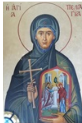
Οσία Πελαγία η Τηνία - Ι. Μ. Κοιμήσεως Θεοτόκου («Κυρίας των Αγγέλων») στο Κεχροβούνι Τήνου