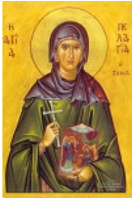
Οσία Πελαγία η Τηνία