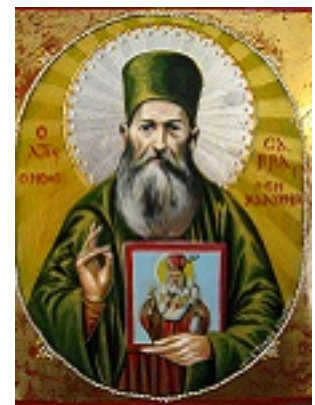
Όσιος Σάββας ο Νέος ο εν Καλύμνω Όσιος Σάββας ο Νέος ο εν Καλύμνω Όσιος Σάββας ο Νέος ο εν Καλύμνω - Χρήστος Στύλος©