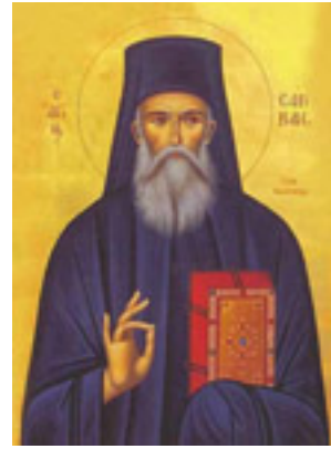
Όσιος Σάββας ο Νέος ο εν Καλύμνω Όσιος Σάββας ο Νέος ο εν Καλύμνω Όσιος Σάββας ο Νέος ο εν Καλύμνω - Λυδία Γουριώτη© ( http://lydiagourioti-iconography.blogspot.com )