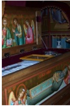
Όσιος Σάββας ο Νέος ο εν Καλύμνω Όσιος Σάββας ο Νέος ο εν Καλύμνω - Χρήστος Στύλος©