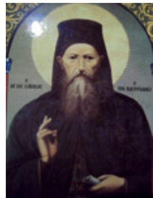
Όσιος Σάββας ο Νέος ο εν Καλύμνω Όσιος Σάββας ο Νέος ο εν Καλύμνω Όσιος Σάββας ο Νέος ο εν Καλύμνω