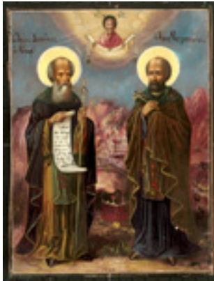
Όσοι Διονύσιος «ο ρήτωρ» και ο υποτακτικός του Άγιος Μητροφάνης ο πνευματικός