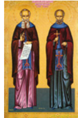
Όσοι Διονύσιος «ο ρήτωρ» και ο υποτακτικός του Άγιος Μητροφάνης ο πνευματικός