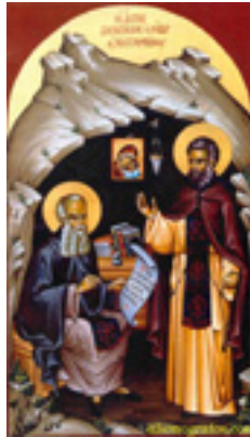
Όσοι Διονύσιος «ο ρήτωρ» και ο υποτακτικός του Άγιος Μητροφάνης ο πνευματικός