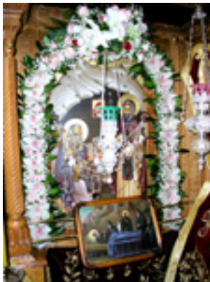
Όσοι Διονύσιος «ο ρήτωρ» και ο υποτακτικός του Άγιος Μητροφάνης ο πνευματικός