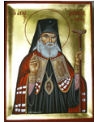
Άγιος Λουκάς Αρχιεπίσκοπος Συμφερουπόλεως και Κριμαίας - Λυδία Γουριώτη© ( lydiagourioti- iconography.blogspot.com )