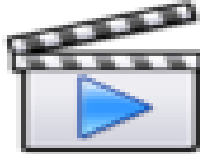
Το Θαύμα στην<br />Ρωσία με το παιδί