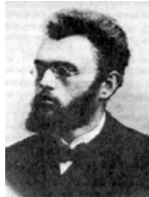
Άγιος Λουκάς Αρχιεπίσκοπος Συμφερουπόλεως και Κριμαίας