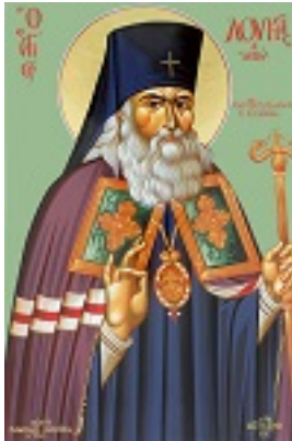
Άγιος Λουκάς Αρχιεπίσκοπος Συμφερουπόλεως και Κριμαίας - Μιχαήλ Χατζημιχαήλ