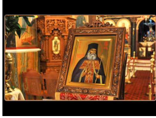
Ο Παρακλητικός Κανών του Αγίου Λουκά του Ιατρού