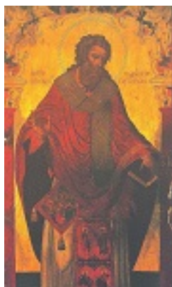
Άγιος Μεθόδιος ο Ιερομάρτυρας