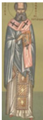
Άγιος Μεθόδιος ο Ιερομάρτυρας