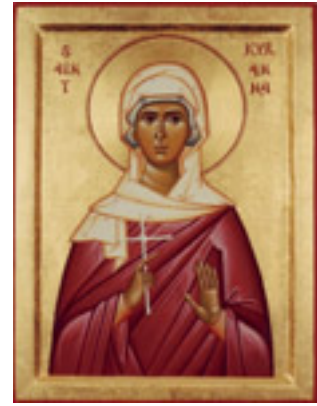
Αγία Κυράννα η Νεομάρτυς