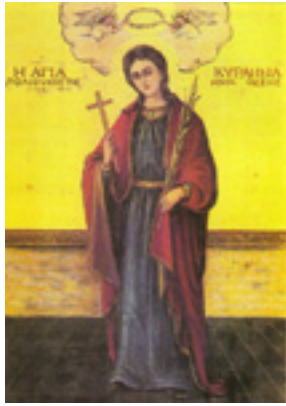
Αγία Κυράννα η Νεομάρτυς