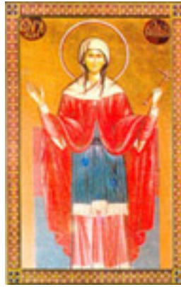
Αγία Κυράννα η Νεομάρτυς