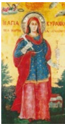
Αγία Κυράννα η Νεομάρτυς