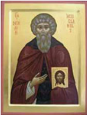
Όσιος Βασίλειος ο Ομολογητής