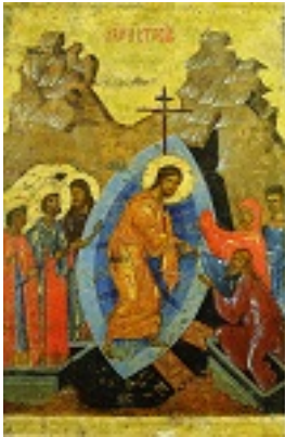
Ανάσταση του Κυρίου