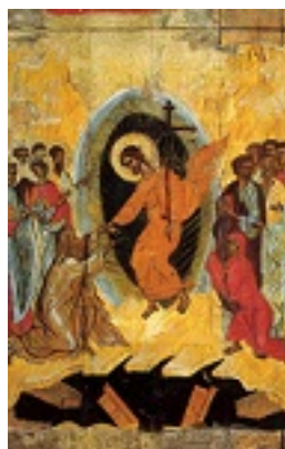
Ανάσταση του Κυρίου