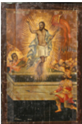
Ανάσταση του Κυρίου - Ι.Ν. Ζωοδόχου Πηγής, Λαρίσης ( http://www.panagialarisis.gr )