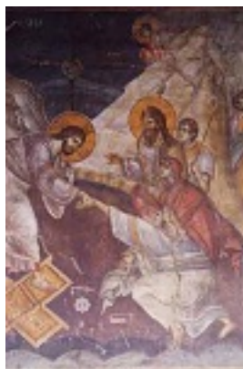
Ανάσταση του Κυρίου - Πρωτάτο Αγίου Όρους, 1290 μ.Χ.