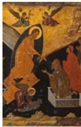
Η Εις Άδου Κάθοδος - άγνωστος ζωγράφος από την Κωνσταντινούπολη, τέλη 14ου αιώνα μ.Χ.