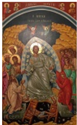
Ανάσταση του Κυρίου - Ιερών Ήσυχαστήριον Αναστάσιος Χριστού (Πειραιεύς)