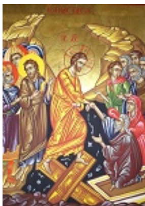
Ανάσταση του Κυρίου - Χρωστήρας© (xrostiras.blogspot.com)