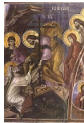
Ανάσταση του Κυρίου