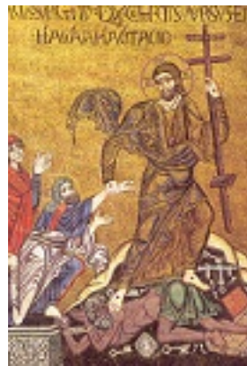
Ανάσταση του Κυρίου (ψηφιδωτό, Άγιος Μάρκος Βενετίας)