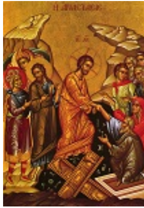
Ανάσταση του Κυρίου