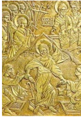
Η Εις Άδου Κάθοδος (Επίχρυσο εγκόλπιο - λειψανοθήκη) - 1507 - 1517 μ.Χ. - Μονή Βατοπαιδίου, Άγιον Όρος