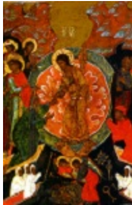
Ανάσταση του Κυρίου