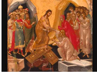
Χριστός Ανέστη (αργό) - Ιωάννης Σταύρου