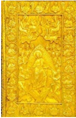
Η Εις Άδου Κάθοδος - Κάλυμμα ευαγγελίου (έκδοση Φοίνικος, Βενετία 1848) - 1671 μ.Χ. - Μονή Σίμωνος Πέτρας, Άγιον Όρος