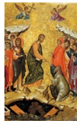
Ανάσταση του Κυρίου