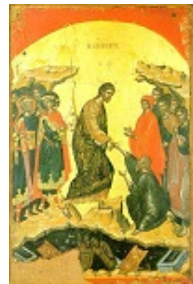
Η Εις Άδου Κάθοδος - 1546 μ.Χ. - Μονή Σταυρονικήτα, Άγιον Όρος (Κρητική σχολή, Θεοφάνης ο Κρής)