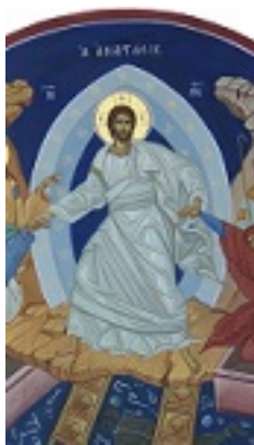
Ανάσταση του Κυρίου