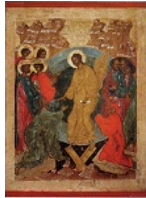
Ανάσταση του Κυρίου