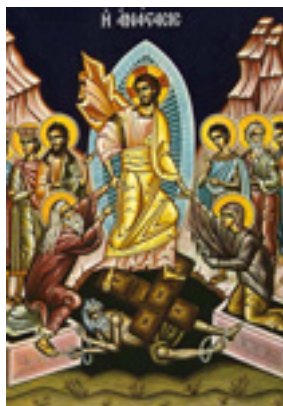
Ανάσταση του Κυρίου