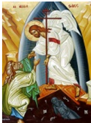
Ανάσταση του Κυρίου - Μιχαήλ Χατζημιχαήλ