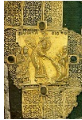
Ανάσταση του Κυρίου (Επένδυση στάχωσης Ευαγγελίου) - 14ος και 15ος αι. μ.Χ. (Κρητική σχολή) - Μονή Ιβήρων, Άγιον Όρος