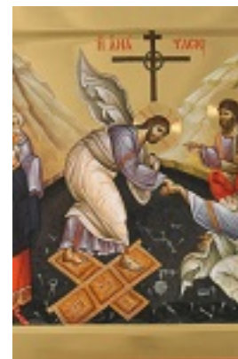
Ανάσταση του Κυρίου - Εικόνα από το Αγιογραφείο της Μονής Βατοπαιδίου