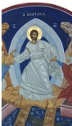
Ανάσταση του Κυρίου