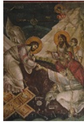
Ανάσταση του Κυρίου