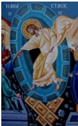
Ανάσταση του Κυρίου - Σάββας Παντζαρίδης©