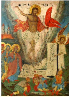
Ανάσταση του Κυρίου - Φορητή εικόνα από τον Ναό της Αγίας Τριάδας στα Καυσοκαλύβια του Αγίου Όρους