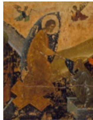
Ανάσταση του Κυρίου