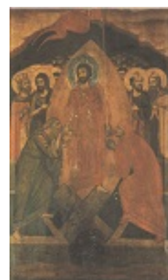
Η Εις Άδου Κάθοδος - Φανάρι, Κωνσταντινούπολη