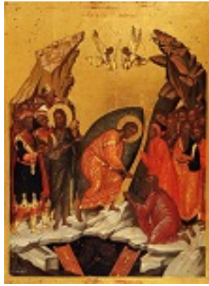
Ανάσταση του Κυρίου - τέλη 17ου αιώνα μ.Χ.