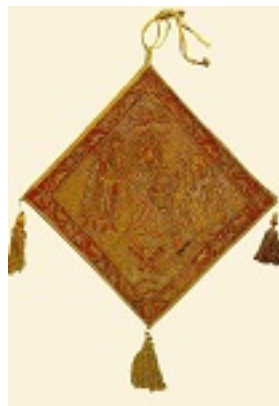
Επιγονάτιο με την Εις Άδου Κάθοδο - 15ος αι. μ.Χ. - Μονή Διονυσίου, Άγιον Όρος