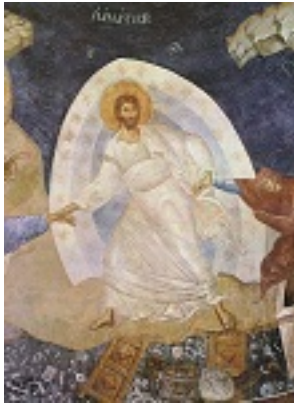
Ανάσταση του Κυρίου