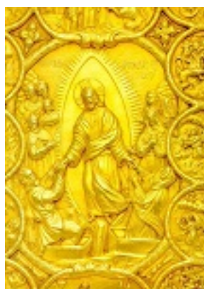
Η Εις Άδου Κάθοδος - Ευαγγέλιο «δια χειρός Λουκά Ουγκροβλαχεί(ας)» και «Ιακώβου ιερομονάχου του Σιμωνοπετρίτου» (Ασήμι, επίχρυσο) - 1629 μ.Χ. - Μονή Σίμωνος Πέτρας, Άγιον Όρος