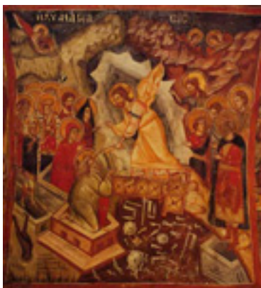
Ανάσταση του Κυρίου - Μεγάλο Μετέωρο, 1483 μ.Χ.