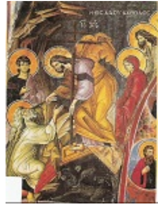
Η Εις Άδου Κάθοδος