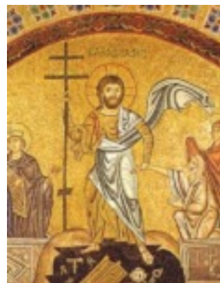
Ανάσταση του Κυρίου