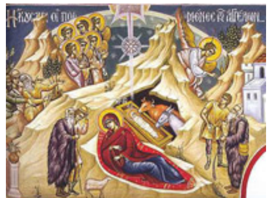
Ἦκουσαν οἱ ποιμένες, τῶν Ἀγγέλων ὕμνούντων....