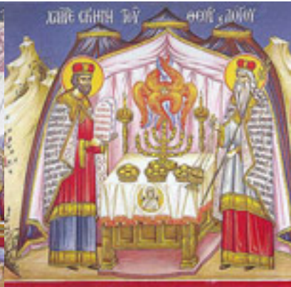
Χαῖρε, σκηνὴ τοῦ Θεοῦ καὶ Λόγου....