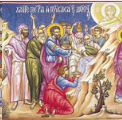
Χαῖρε, πέτρα ἡ ποτίσασα τοὺς διψῶντας τὴν ζωὴν....