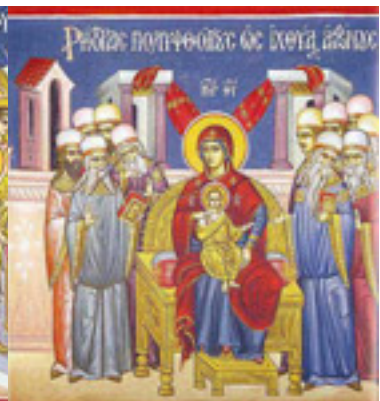
Ρήτορας πολυφθόγγους, ὡς ἰχθύας ἀφώνους....