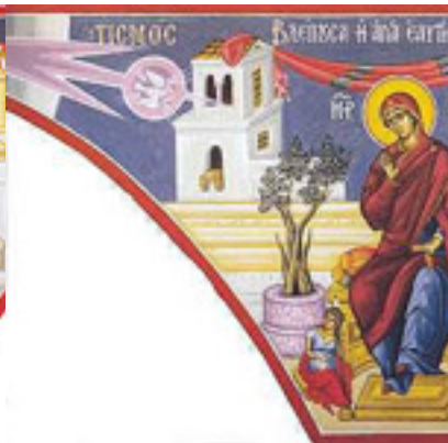
Βλέπουσα ἡ Ἁγία, ἐαυτὴν ἐν ἀγνείᾳ....