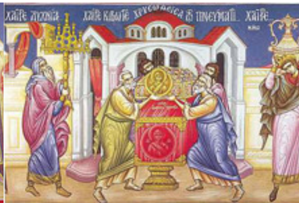
Χαῖρε, κιβωτὴ χρυσοθεῖσα τῷ Πνεύματι....