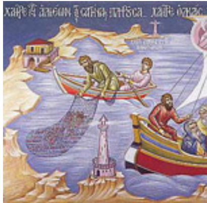
Χαῖρε, τῶν ἀλιέων τὰς σαγήνας πληροῦσα.... / Χαῖρε, ὀλκὰς τῶν θελώντων σωθῆναι....