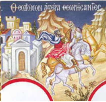
Θεοδρόμον ἄστερα, θεωρήσαντες Μάγοι....