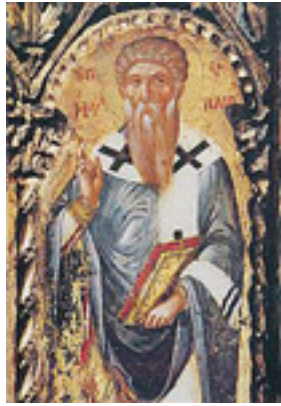
Άγιος Τριφύλλιος Επίσκοπος Λήδρας