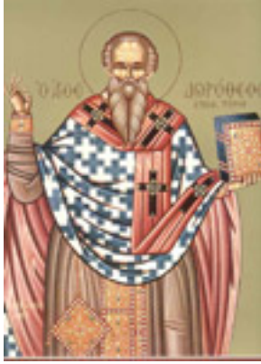
Άγιος Δωρόθεος Ιερομάρτυρας επίσκοπος Τύρου