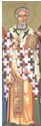
Άγιος Μητροφάνης Αρχιεπίσκοπος Κωνσταντινούπολης