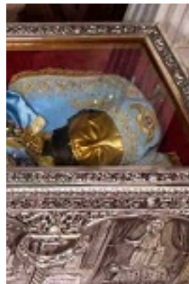
Η Λάρνακα του Οσίου Ιωάννη του Ρώσου