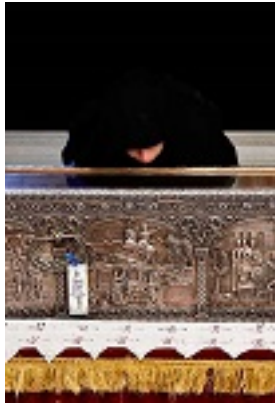
Η Λάρνακα του Οσίου Ιωάννη του Ρώσου