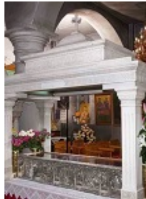
Η Λάρνακα του Οσίου Ιωάννη του Ρώσου