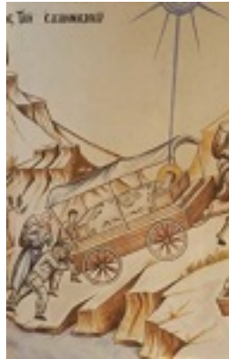
Όσιος Ιωάννης ο Ρώσος - Η Μαρτυρική Έξοδο του Ελληνισμού της Καππαδοκίας