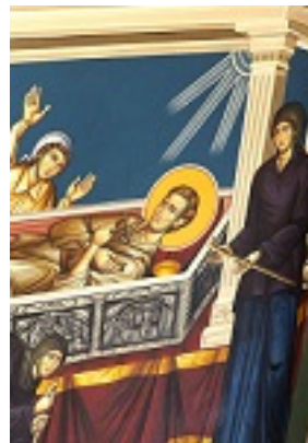
Η κοίμηση του Οσίου Ιωάννη του Ρώσου