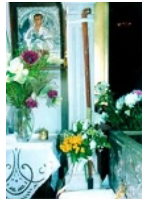
Το μαστουίνι της Μαρίας Σιάκα