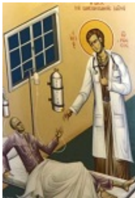
Όσιος Ιωάννης ο Ρώσος - Ηΐασις του καρκινοπαθούς Ιατρού