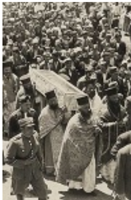
Νέο Προκόπιο Ευβοίας, Λιτανεία του Οσίου Ιωάννου του Ρώσου - 27/05/1940 μ.Χ.