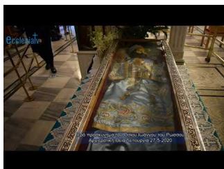
Οσίου Ιωάννου του Ρώσσου - Αρχιερατική Θ. Λειτουργία 27-5-2020