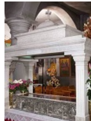
Η Λάρνακα του Οσίου Ιωάννη του Ρώσου