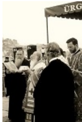
Ο Οικουμενικός Πατριάρχης Βαρθολομαίος τελεί την πανήγυρη του Οσίου Ιωάννου του Ρώσου στο Προκόπιο Καππαδοκίας το 2001 μ.Χ.