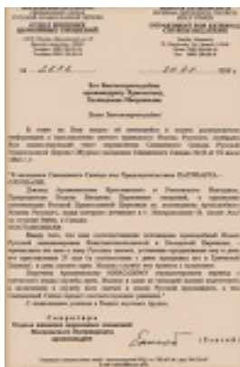
Το πρωτότυπο έγγραφο του Πατριαρχείου Μόσχας σχετικά με την αγιοκατάταξη του Οσίου Ιωάννου του Ρώσου