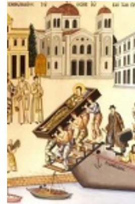
Όσιος Ιωάννης ο Ρώσος - Η Υποδοχή του Ιερού Σκηνώματος του Οσίου Ιωάννη και των Προσφύγων στη Χαλκίδα