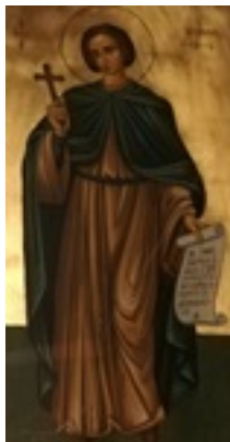
Όσιος Ιωάννης ο Ρώσος