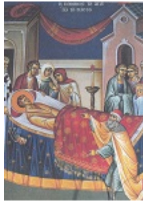
Η κοίμηση του Οσίου Ιωάννη του Ρώσου