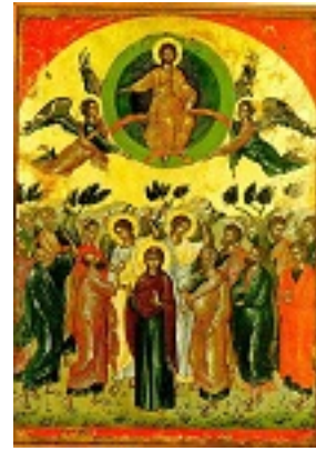
Η Ανάληψη του Κυρίου - 1546 μ.Χ. - Μονή Σταυρονικήτα, Άγιον Όρος (Κρητική σχολή, Θεοφάνης ο Κρής)