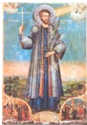
Άγιος Παύλος ο Πελοποννήσιος ο Οσιομάρτυρας