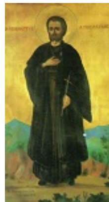
Άγιος Παύλος ο Πελοποννήσιος ο Οσιομάρτυρας