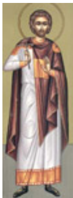
Άγιος Παύλος ο Πελοποννήσιος ο Οσιομάρτυρας