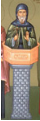
Όσιος Συμεών ο Θαυμαστορείτης