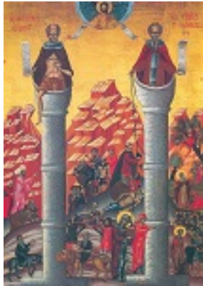
Όσιος Συμεών ο Στυλίτης και Όσιος Συμεών ο Θαυμαστορείτης