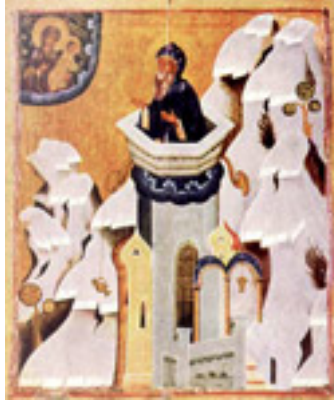
Όσιος Συμεών ο Θαυμαστορείτης