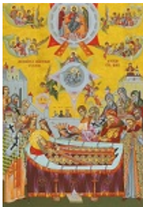
Η κοίμηση του Αγίου Στεφάνου της Μολδαβίας