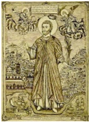
Άγιος Κωνσταντίνος ο Υδραίος Νεομάρτυρας - 27 Ιουλίου 1829 μ.Χ.

(Χαράκτης: Ιεροδιάκονος Αγαθάγγελος Τριανταφύλλου εκ Σερρών) - Μονή Σίμωνος Πέτρας, Άγιον Όρος