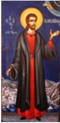
Άγιος Κωνσταντίνος ο Υδραίος Νεομάρτυρας