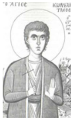
Άγιος Κωνσταντίνος ο Υδραίος Νεομάρτυρας