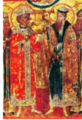
Όσιος Κασσιανός ο Έλληνας και Θαυματουργός