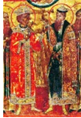
Όσιος Κασσιανός ο Έλληνας και Θαυματουργός