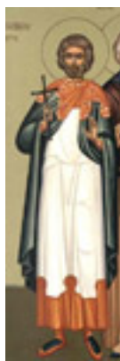
Άγιος Θαλλέλαιος ο Ανάργυρος