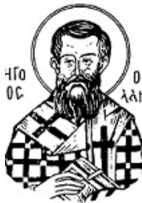
Άγιος Γρηγόριος ο Παλαμάς Αρχιεπίσκοπος Θεσσαλονίκης, ο Θαυματουργός