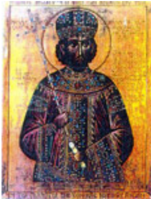
Κωνσταντίνος ΙΑ' Παλαιολόγος