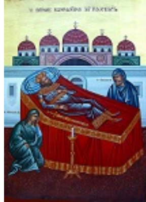
Θρήνος Κωνσταντίνου Παλαιολόγου - Π. Κούβαρη και Ι. Χ. Θωμάς