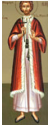
Άγιος Νικόλαος εκ Μετσόβου