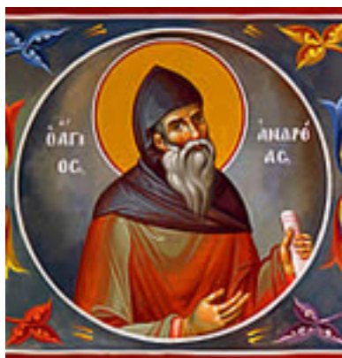
Όσιος Ανδρέας και Θαυματουργός