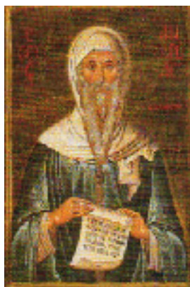
Όσιος Ανδρέας και Θαυματουργός