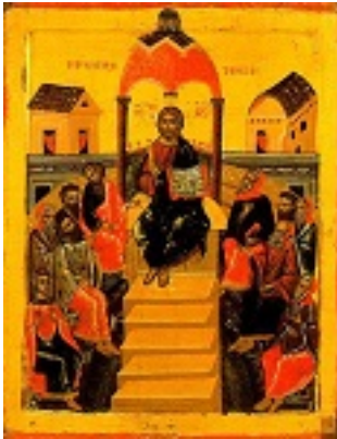
Μεσοπεντηκοστή - πρώτο μισό 18ου αι. μ.Χ. - Σκήτη Αγίας Άννης, Άγιον Όρος