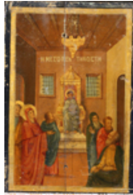
Μεσοπεντηκοστή - Ι.Ν. Ζωοδόχου Πηγής, Λαρίσης ( www.panagialarisis.gr )