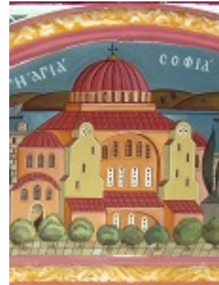
Ναός της του Θεού Σοφίας - Βασιλειος Μπρούσαλης - Αγία Τριάς Νέου Ηρακλείου