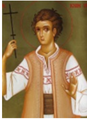
Άγιος Ιωάννης ο Βλάχος