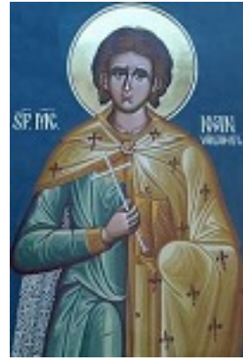
Άγιος Ιωάννης ο Βλάχος