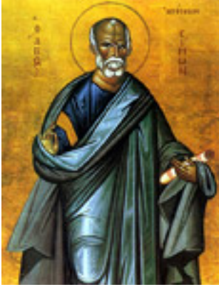
Άγιος Σίμων ο Απόστολος, ο Ζηλωτής