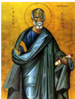
Άγιος Σίμων ο Απόστολος, ο Ζηλωτής