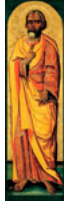
Άγιος Σίμων ο Απόστολος, ο Ζηλωτής