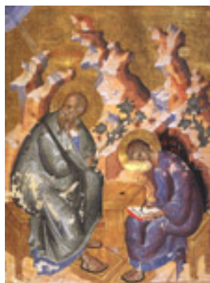
Άγιος Πρόχορος καὶ Ἅγιος Ἰωάννης ο Θεολόγος