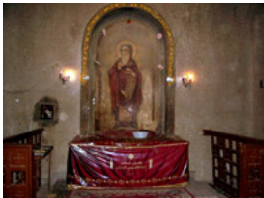
Η λάρνακα του Αγίου Αθανασίου />(όπου υπάρχουν τα λείψανά του)<br />κάτω από τον καθεδρικό ναό του<br />Αγίου Μάρκου, Κάιρο