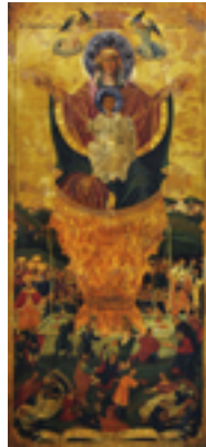
Ζωοδόχος Πηγή - Ι.Ν. Ζωοδόχου Πηγής, Λαρίσης (www.panagialarisis.gr)