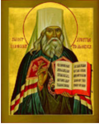
Όσιος Ιννοκέντιος Βενιάμινωφ Μητροπολίτης Μόσχας και Ιεραπόστολος Αλάσκας