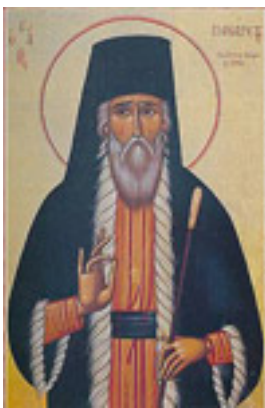
Άγιος Πανάρετος Αρχιεπίσκοπος Πάφου